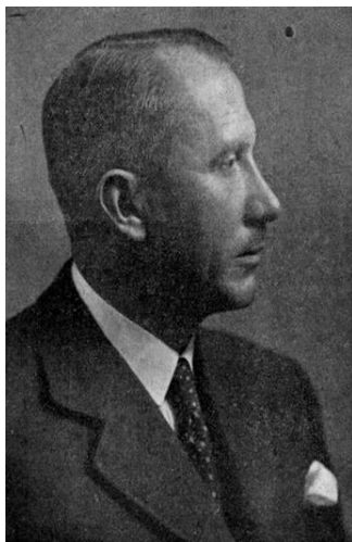
Полк. Євген Коновалець. (* 14. VI. 1891, † 23. V. 1938.) Голова першого (7. VI. 1927 — 3. II. 1928) і другого (від Конгресу У. Н.) Проводу Українських Націоналістів.

"Наради Конгресу розпочалися в 10 год. 15 хв. 28 січня б. р. у Відні. У нарадах брало участь 30 членів Конгресу, що прибули з різних українських земель, Чехо-Словаччини, Франції, Німеччини, Гданська, Бельгії й Австрії, та двоє гостей. З огляду на різні перешкоди не могли прибути запрошені на Конгрес представники з Югославії, Туреччини й Люксембургу. Представник із Злучених Держав з огляду на зміну накресленої дати, приїхав після закінчення нарад. Усіх учасників запрошено персонально, а не на підставі того чи іншого заступництва поодиноких організацій.