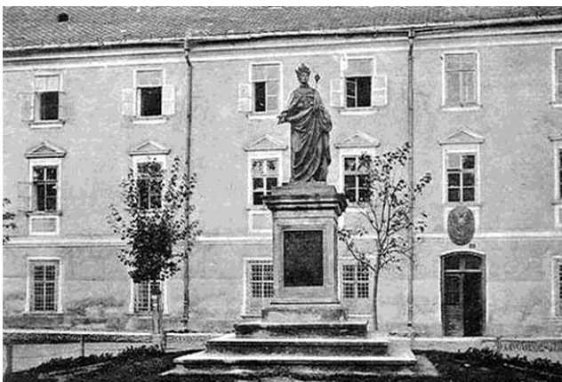
Станіславська гімназія (світлина 1910 р.)

Народився Остап у родині священника. Після закінчення школи у Коломиї навчався у 1859–1868 роках у вищій гімназії в Станіславові. В гімназії разом з Володимиром Навроцьким організував учнівську "Громаду", а з 1865 року став видавати і редагувати рукописну газету "Зірка". Тут з'явилися перші дописи та поетичні спроби О. Терлецького, який навіть намагався залучати до співпраці з часописом Юрія Федьковича і їздив до нього у Сторонець - Путилів.