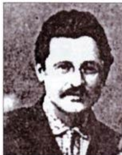
Іван Шарий, учасник бою під Крутами.