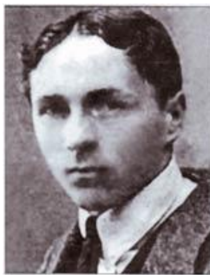
Григорій Піпський, загинув у бою під Крутами.