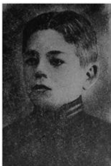
Микола Корпан загинув у бою під Крутами