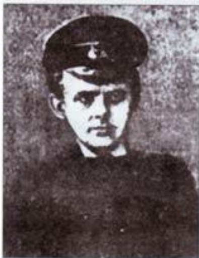
Микола Ганкевич, загинув у бою під Крутами.