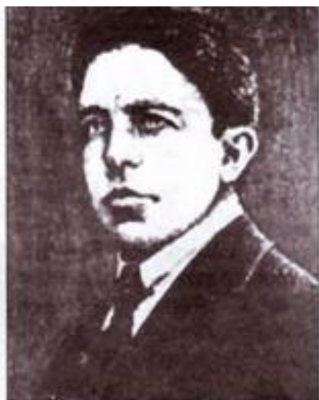
Осип Твердовський, учасник бою під Крутами.

Крути стали легендою, символом героїзму і жертвності молодого покоління у боротьбі за незалежну Україну.