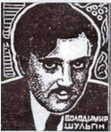
Володимир Шульгин, загинув у бою під Крутами